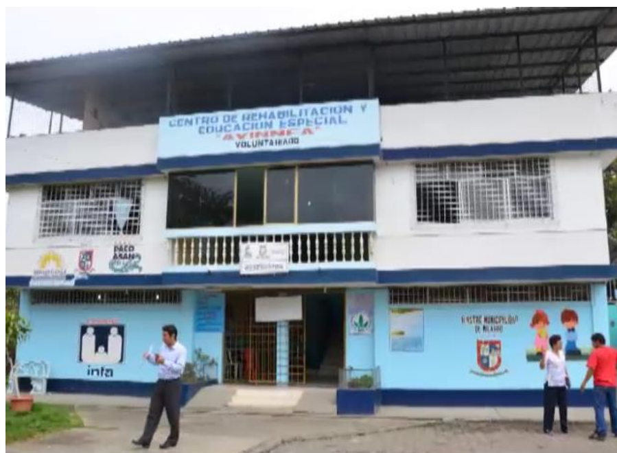
Figura 1: Centro de Educación Especial AVINNFA

Con esta realización del proyecto se podría alcanzar a familias con bajos recursos económicos que no podrían incorporar a sus hijos en los centros sino que debido a la facilidad de elaboración de los equipos ortopédicos, la familia misma se encargaría de fabricar los equipos ortopédicos con materiales de bajo costo y así minimizar el problema de la deficiencia de los equipos ortopédicos para el desarrollo de las habilidades del niño. Por la deficiencia de estos equipos ortopédicos que presenta dicha comunidad, ya sea por su costo muy elevado o difíciles de encontrar en el mercado nacional, se optó por el diseño, creación e implementación del equipos ortopédicos en AVINNFA y así poder ayudar con las necesidades que presenta dicha institución.