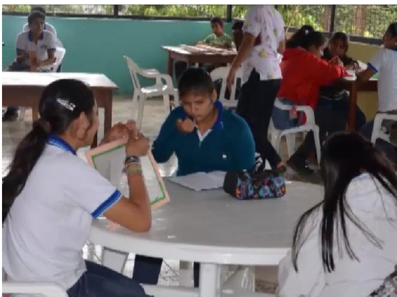
Figura 2: Niños en AVINNFA