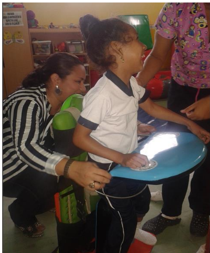
Figura 4: Prueba con niños